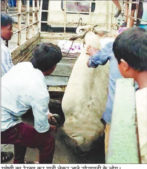
मवेशी का रेस्क्यू कर गाड़ी लेकर जाते सोसायटी के लोग।