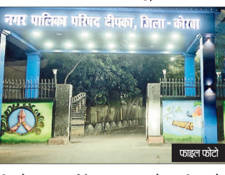
नगर पालिका परिषद दीपका, जिला - कोरबा

दीपका नगर पालिका ने छत्तीसगढ़ रेलवे विभाग (सीईडब्ल्यूआरएल) पर कार्रवाई करते हुए 31 लाख 99 हजार रुपये की पेनाल्टी वसूली है। यह कार्रवाई चाकाबुडा और कृष्णा नगर में रेलवे के कार्य के दौरान नगर पालिका द्वारा स्थापित पेयजल पाइपलाइन को बिना अनुमति तोड़े जाने पर की गई। घटना के बाद नगर पालिका ने तत्काल हाइवा पोर्कलैंड, ट्रेक्टर समेत 11 वाहनों की जब्त कार्यवाही की थी। इस पूरे प्रकरण में कटघोरा एसडीएम की मध्यस्थता से आपसी समझौता हुआ,