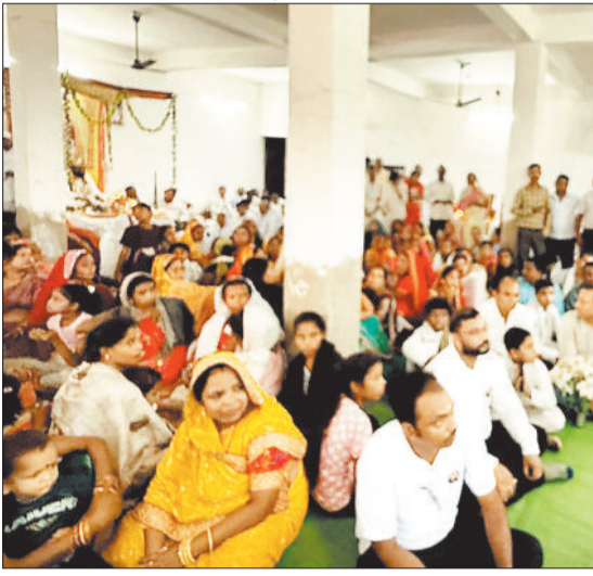
कार्यक्रम में उपस्थित स्थानीय जनमानस।