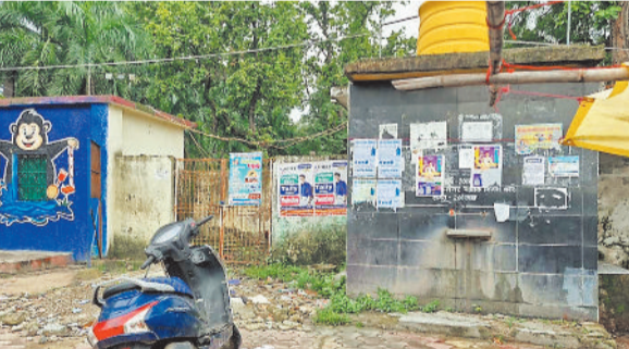
जर्जर पानी टंकी।

कामलेक्स के व्यवसायियों का कहना है कि उन्होंने कई बार निगम अधिकारियों को इस परेशानी से अवगत कराया लेकिन कोई ठोस कदम नहीं उठाया गया। निगम अपने ही परिसर में मूलभूत सुविधा नहीं दे