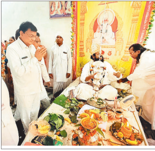
पूर्वा अर्चना करते उद्योग मंत्री लखनलाल देवांगन।

ये मेरा सौभाग्य है की आज गुरु पूर्णिमा के पावन अवसर पर रिसदी स्थित सहस्र कबीर आश्रम में आयोजित चौका आरती और पूजन में सम्मिलित होने का अवसर प्राप्त हुआ। आश्रम से मेरा वर्षों से जुड़ाव रहा है। आप सभी ने विधानसभा और नगर निगम चुनाव में भाजपा को आशीर्वाद देकर रिकॉर्ड मतों से जिताया। डबल इंजन की सरकार ने नगर निगम के सभी वार्डों में पहले वित्तीय वर्ष में 400 करोड़ की राशि की स्वीकृति दी है जिसका काम तेज गति से चल रहा है।