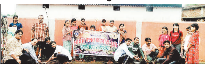
पौधरोपण कार्यक्रम में शामिल लायन्स क्लब के पदाधिकारी।