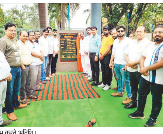
शुभारंभ करते अतिथि।

कटघोरा नगर पालिका परिषद अंतर्गत नगर के सौंदर्यीकरण और नागरिक सुविधाओं को बढ़ावा देने के उद्देश्य से नगर के इकलौते पुष्पवाटिका और नवनिर्मित चौपाटी का लोकार्पण समारोह बड़े ही